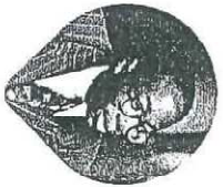
LÉOPOLD SÉDAR SENGHOR

N ew York ! D'abord j'ai été confondu 1 par ta beauté, ces grandes filles Si timide d'abord devant tes yeux de métal bleu, ton sourire de givre Si timide. Et l'angoisse au fond des rues à gratter-ciel Levant des yeux de chouette parmi l'éclipse du soleil. 5 Sulfureuse 2 ta lumière et les fûts 3 livides, dont les têtes foudroient le ciel Les gratte-ciel qui défient les cydones sur leurs muscles d'acier et leur peau Mais quinze jours sur les trottoirs chauves de Manhattan – C'est au bout de la troisième semaine que vous saisissez la fièvre en un bond [de jaguar [patinée de pierres.